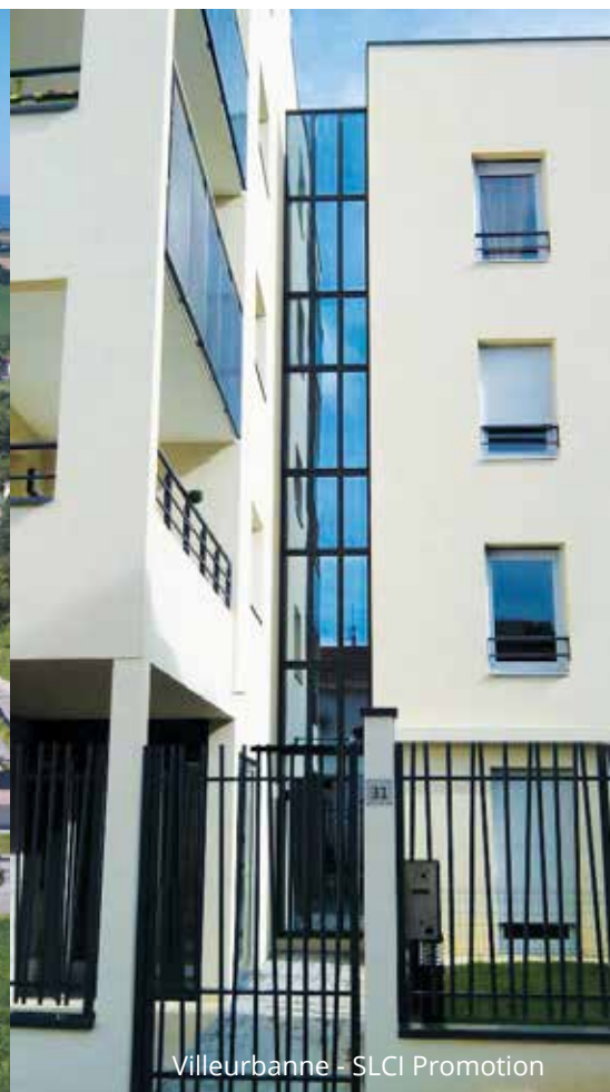
Villeurbanne - SLCI Promotion