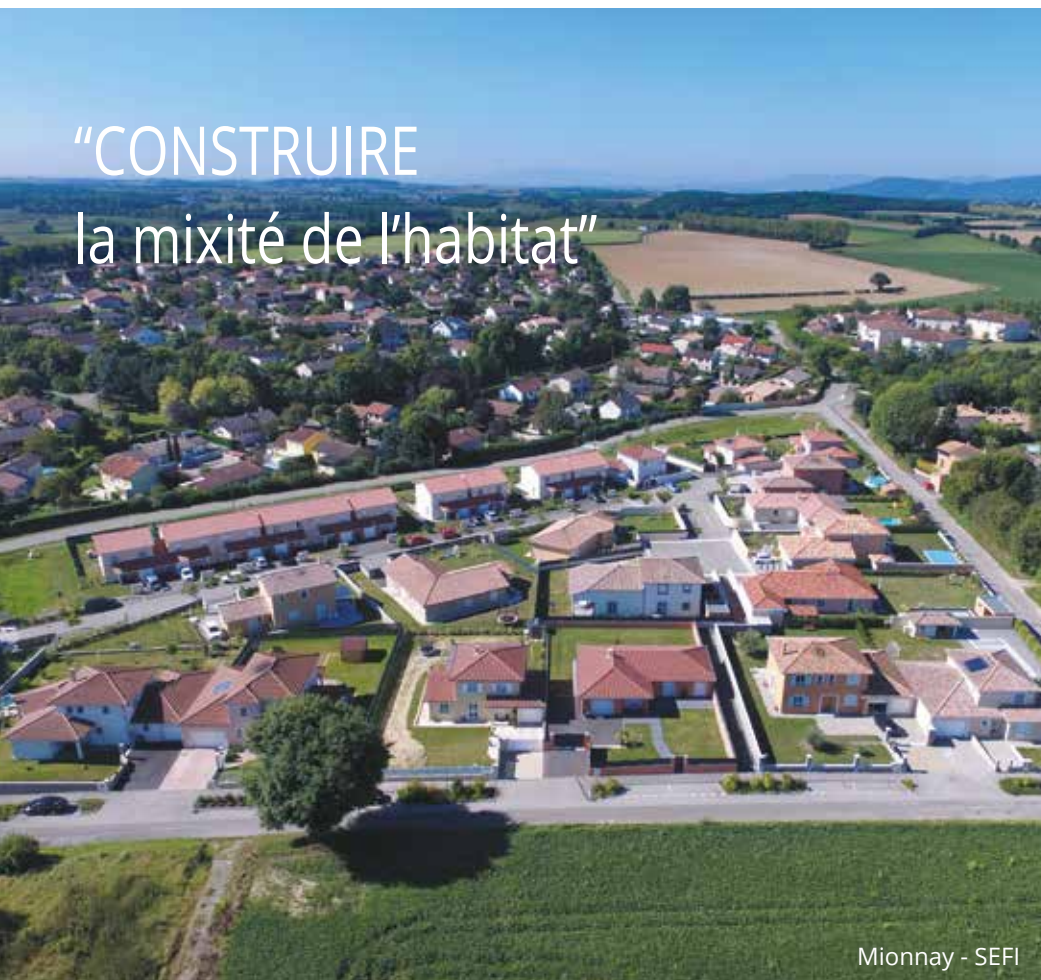
Mionnay - SEFI